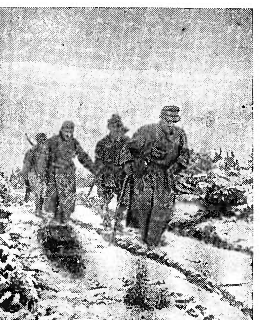
Am Duklapas. Es regnet und schneit ununterbrochen. Bis zum Fuß dieser Anhöhe haben Pferde die schweren Munitionskisten getragen, bis hinunter auf die Bergstellungen müssen die Männer selbst zapfen.

Als zweiter Brennpunkt zeichnete sich der Raum zwischen Saargemünd und Hagenau ab, wo sechs feindliche Divisionen im Angriff stehen. An der Bahnlinie Saargemünd-Hagenau wechselten einige bereits seit Tagen in der Hauptkampflinie liegende Ortschaften mehrmals den Besitzer.