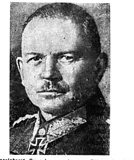
Generaloberst Guorian wurde vom Führer in den Generalstab berufen.