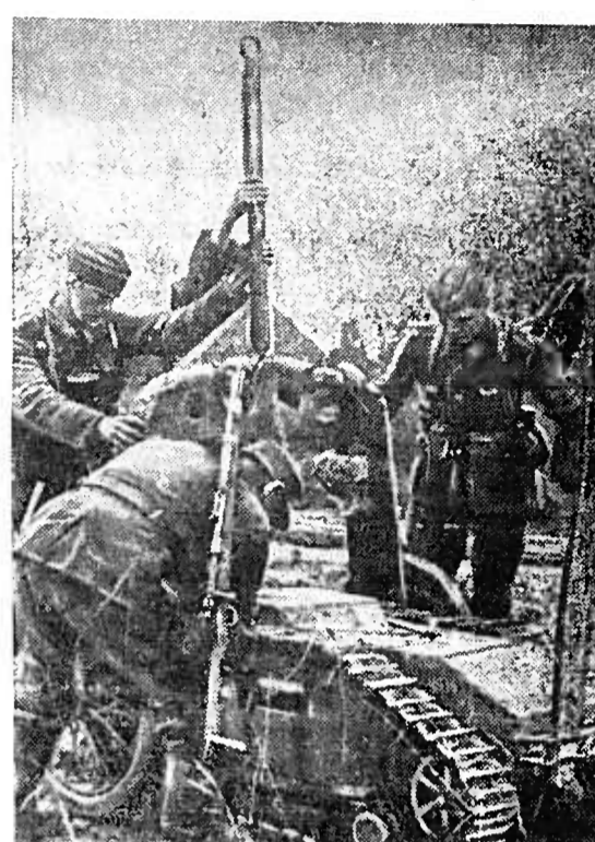
Ein Griff und der Gottlieb nicht, eigenen Füßen. Die Fahrt des gefürchteten Panzer- und Panzertrucks zeigen das zu verheerenden ...

Schweine Serbel. Hergestellt in den Persil-Werken. Gut zur Händereinigung. Nach schmutzigen Arbeiten: Schuputzen, Herd- und Ofenreinigung, Karöffschalen usw., nimmt man zum Händereinigen ATA anwender allein — oder mit etwas Seife.