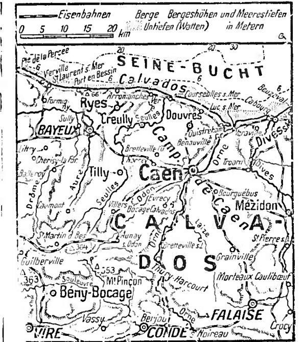
Geistlicher Kampfplatz der Invasionsfront, Angriffsbereich der Engländer

Die Schlacht bei Caen von neuem entbrannt Wieder wachsender Druck der Volkswaffen am oberen Bug und am Nijemen — In der Mitte der italienischen Front erfolgreiche Abwehrkämpfe