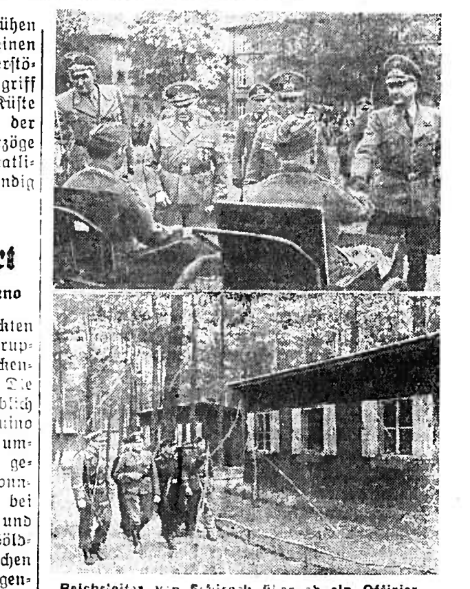
Reichsleiter von Schulz besucht die Offiziersbewerberlager...