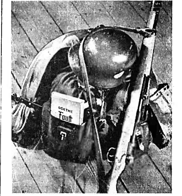
Der „Front“ im Trenchen Auch an der Front bleibt die Schusskraft nach deutschem Kämpfer und Gestirbt in unseren Soldaten bewahrt. Das ist das deutsche Soldat, den „Front“ im Trenchen trägt, ist keine leere Redensart. „Front“ ist ein wehrvolles Wort mit dem Soldatenwort. PK-Anfall: Kriegerberichter Morocutti (Wb.)

Neue Ritterkreuzträger Der Führer verlieh auf Vorschlag des Oberbefehlshabers der Luftwaffe, Reichsmarschall Göring, das Ritterkreuz des Eisernen Kreuzes an Leutnant Neumüller, Flugzeugführer in einem Schlachtgeschwader.