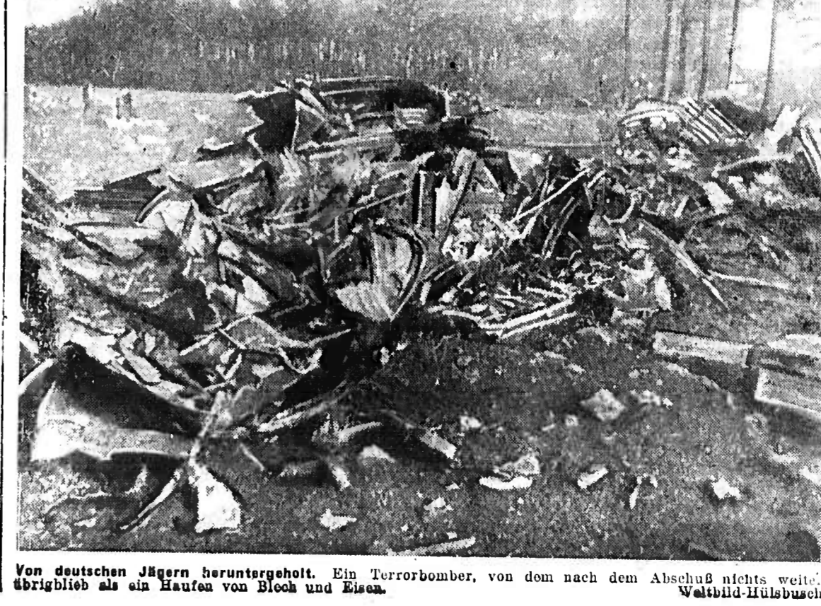
Von deutschen Jagern heruntergehoht. Ein Terrorbomber, von dem nach dem Abschuss nichts weiter übriggeblieben ist als ein Haufen von Blech und Eisen.

Die italienischen Fronten sind weiterhin ruhig. Unsere Truppen sind in den Stellungen verbleibend. Die Kampfhandlungen haben sich über einen weiten Bereich der Front erstreckt. Unsere Truppen haben sich tapfer gegen die Feinde verteidigt und haben ihnen schwere Verluste zugefügt.