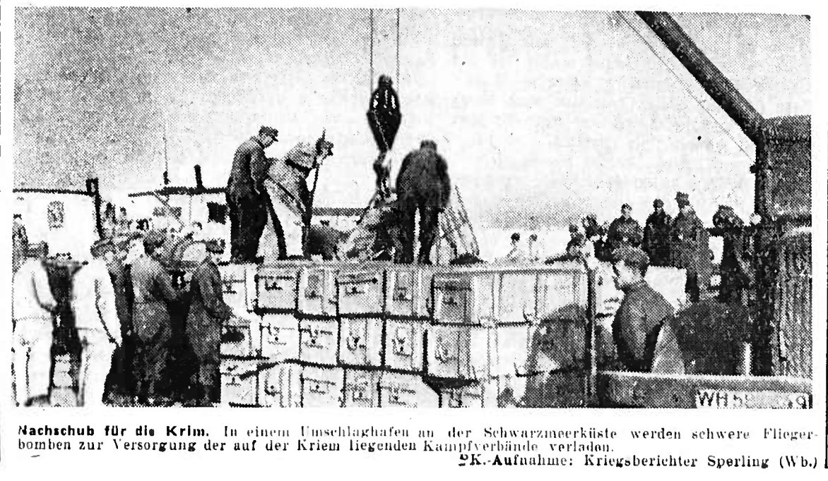
Nachschub für die Krim. In einem Umschlagwagen an der Schwarzenerkiste werden schwere Flugzeugbomben zur Versorgung der auf der Krim liegenden Kampfverbände verladen.