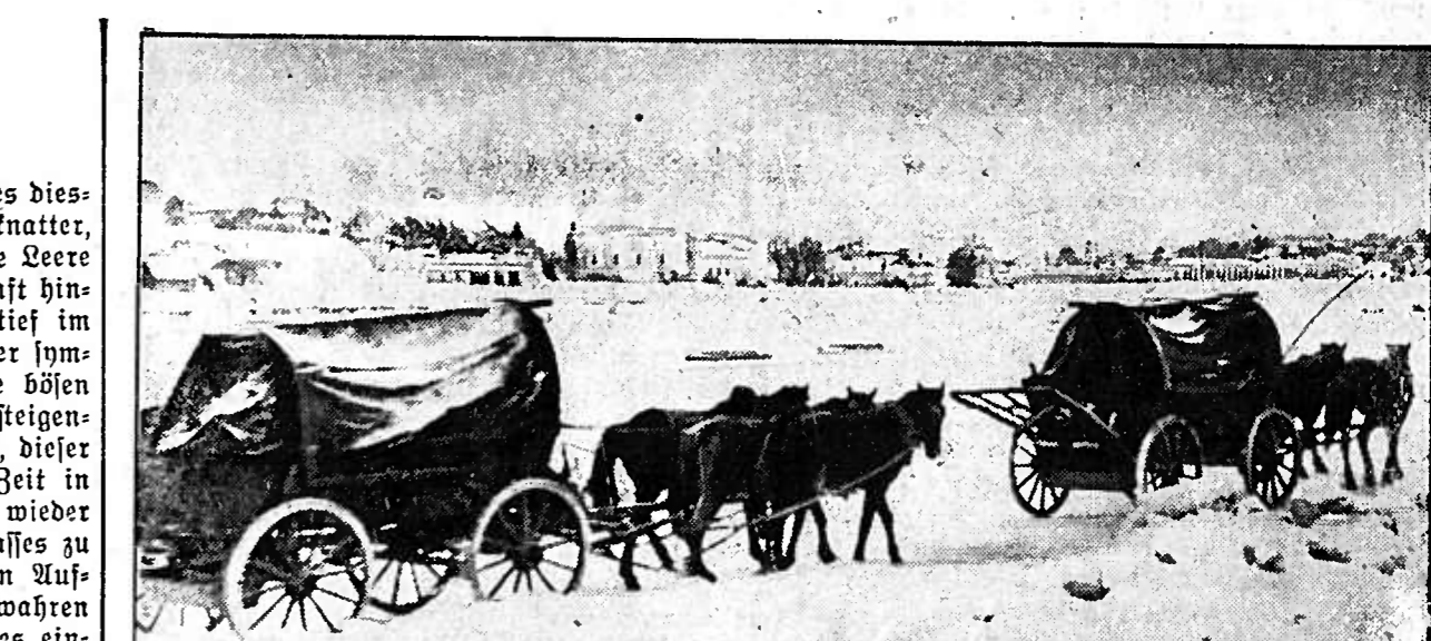
Nachschub durch Schnee und Eis. Durch Schnee und Eis und strende Kälte bahnt sich der Nachschub seinen Weg nach vorn.

Wieder hat ein Jahr seinen Lauf vollendet. Ein flüchtiger Überblick nur an der großen Weite der Welt und demod für jeden einzelnen Welle des Lebens!