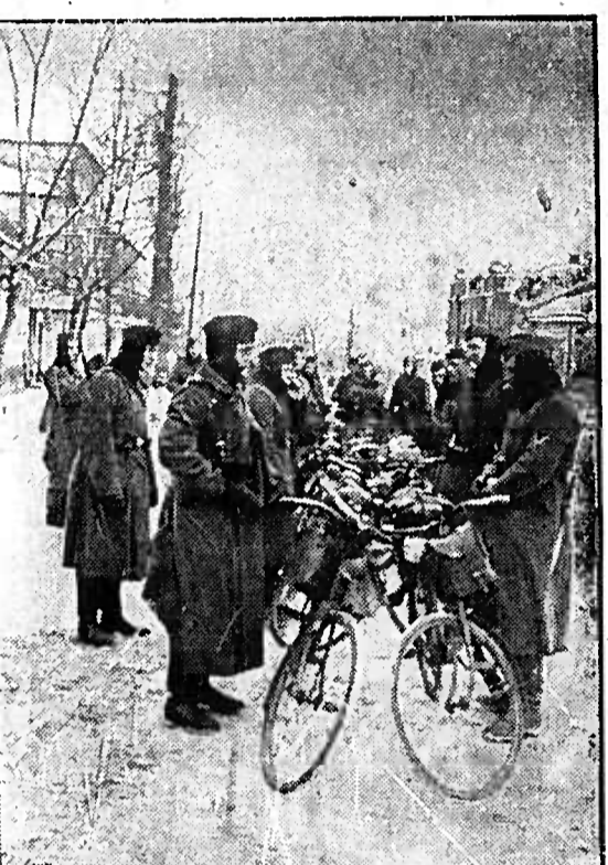
Eine Radfahrerabteilung auf kurzer Fahrt im Osten.

An der englischen Ostküste vernichteten Kampf- und Sturmkommandoverbände die Angriffe gegen feindliche Schiffe fort. Sie vernichteten drei Transporter mit zusammen 2800 brit. und beschädigten ein Kanonenboot sowie vier weitere Schiffe.