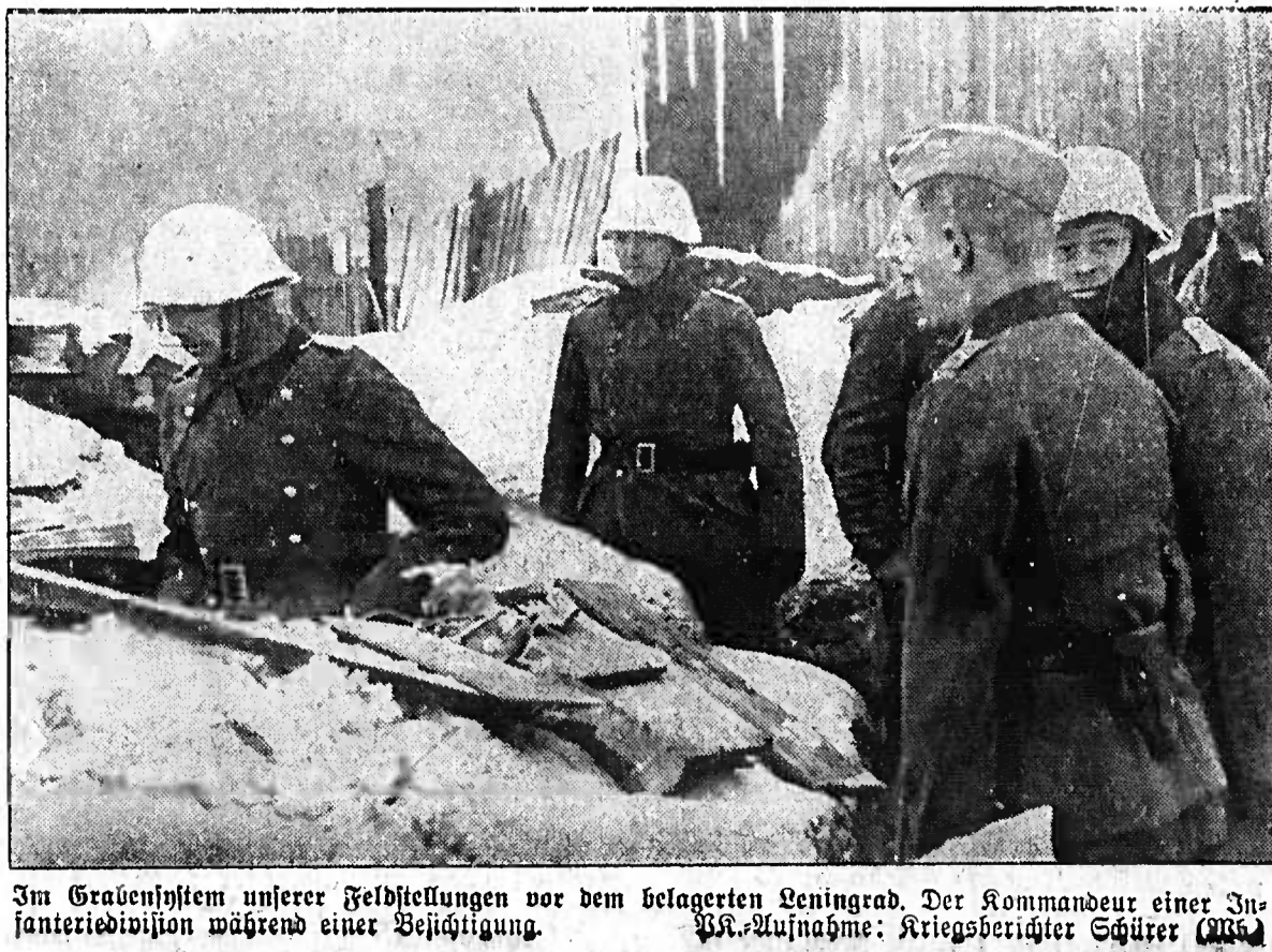
Im Grabensystem unserer Feststellungen vor dem betagerten Leningrad. Der Kommandeur einer Infanteriedivision während einer Besichtigung.

1 Drehstrommotor 1,5 PS, 220 V. (Drummen) ganz neu 1 Warmwasserboiler 1 Obstmühle u. Presse (Tro te) 1 Strahlpumpe