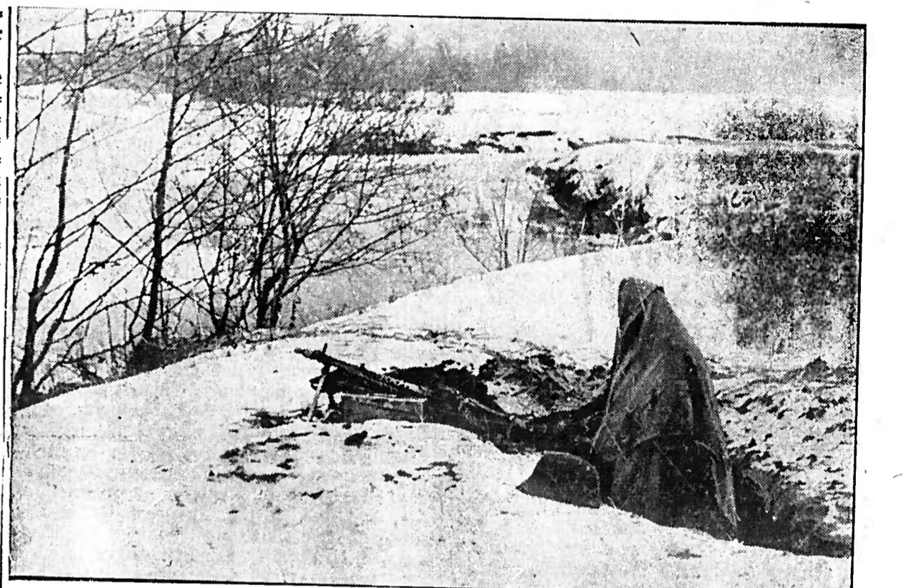
Borgholmer MG-Posten. Unabhängig muß die weiße Landschaft beachtet werden, denn der verbliebenste Gegner unternimmt immer wieder verzweifelte Gegenangriffe.

Der australische Kreuzer „Sdney“ durch den australischen Hilfskreuzer „Cormoran“ gehört zu den ruhmvollsten Waffentaten der Seefriedensgeschichte. Hilfskreuzer sind ehemalige Handelschiffe, die für Kriegszwecke bewaffnet werden. Handelsdampfer, selbst schnelle Passagierdampfer, bleiben in ihrer Geschwindigkeit weit hinter den Spitzgeschwindigkeit moderner Kriegsschiffe zurück. Handelschiffe haben keinen Panzerfuß und die Bewaffnung für Kriegszwecke reicht selbstverständlich nicht an die Bewaffnung eines regulären Kreuzers heran.