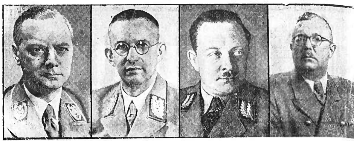
Adolf Hitler, Reichskanzler, im Gespräch mit Reichsminister für die besetzten Ostgebiete, Reichsminister für die besetzten Ostgebiete, Reichsminister für die besetzten Ostgebiete

Die Rom, 18. Nov. Die Bombardierung der kriegswichtigen Anlagen, Rüstungsfabriken und Versorgungszentren von Leningrad hat die eingeschlossenen Bolschewiken zu einer vollständigen Constatierung des flüchtigen Stadtlebens gezwungen. Unter dem Druck der katastrophalen Verhältnisse sind in den letzten Tagen wieder