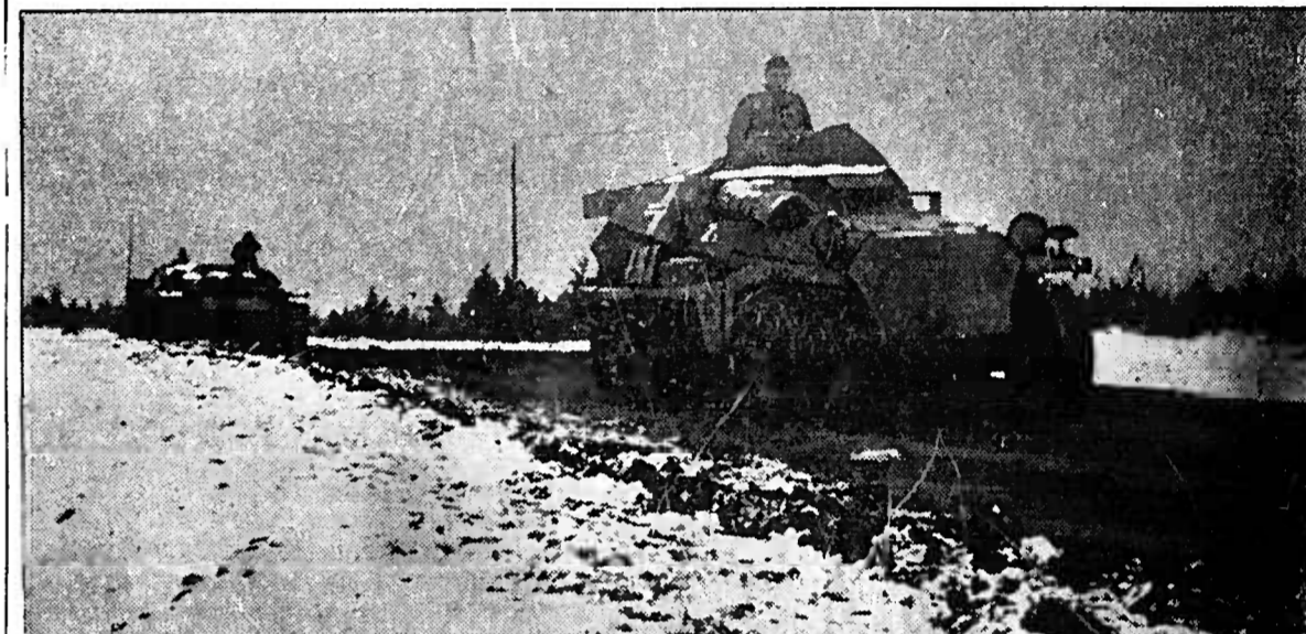
Das Kampfgebiet der Waldbühnen. Panzerfahrzeuge auf dem Vormarsch in einen neuen Verteidigungsraum.

Die deutsche Luftwaffe hat in den letzten Tagen im Osten neue erfolgreiche Angriffe durchgeführt. In der Nacht zum 19. November haben deutsche Bomber in der Gegend von Moskau und Leningrad neue erfolgreiche Angriffe durchgeführt. Die deutsche Luftwaffe hat in den letzten Tagen im Osten neue erfolgreiche Angriffe durchgeführt. In der Nacht zum 19. November haben deutsche Bomber in der Gegend von Moskau und Leningrad neue erfolgreiche Angriffe durchgeführt.