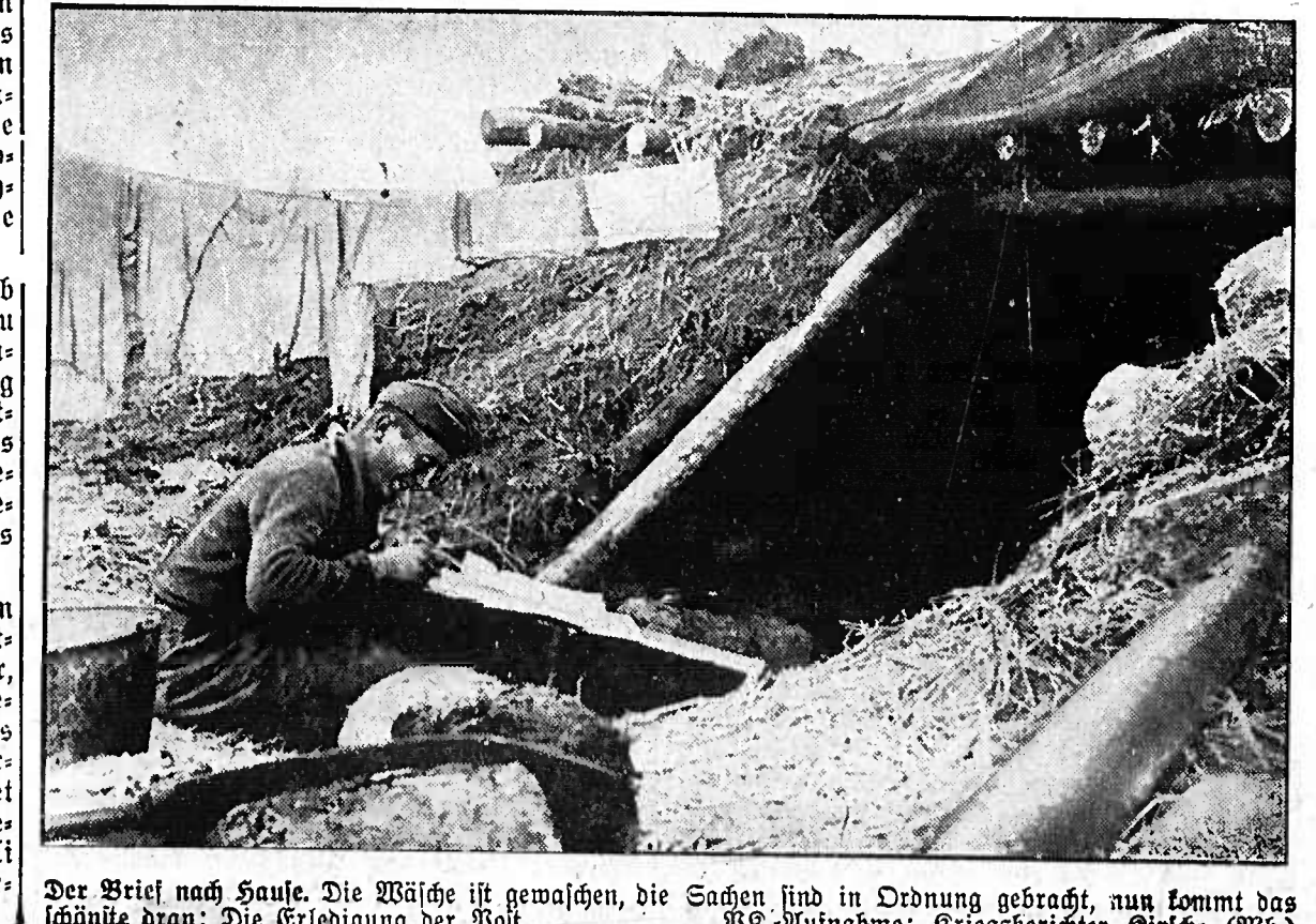
Der Brief nach Hause. Die Wäsche ist gewaschen, die Sachen sind in Ordnung gebracht, nun kommt das nächste Paket. Die Erleichterung der Post.

Nach dem siegreichen Polenfeldzug und dem Sieg im Westen, an denen gerade die Luftwaffe in hervorragender Weise beteiligt war, erhielt Udet, der am 1. April 1940 zum Generalmajor befördert worden war, das Amt des Chef der Fliegerei. Er wurde zum Generalmajor befördert und erhielt das Amt des Generalstabschefs. Am 19. April 1940 wurde Udet zum Generaloberst befördert.