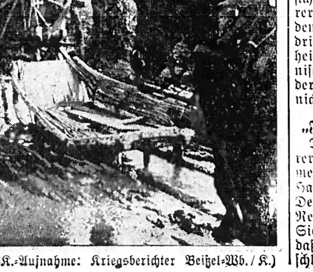
General Regen" kann uns nicht aufhalten.

Der römische Sonntagspresse berichtet ausführlich über die Rede des Führers vom 9. Nov. sowie über die Feier in München. Alle Blätter unterzeichnen die lateinische Feststellung des Führers, daß jede deutsche Schicksalsbestimmung das Recht habe, sich zu verteidigen, wie immer sie angegriffen werde.