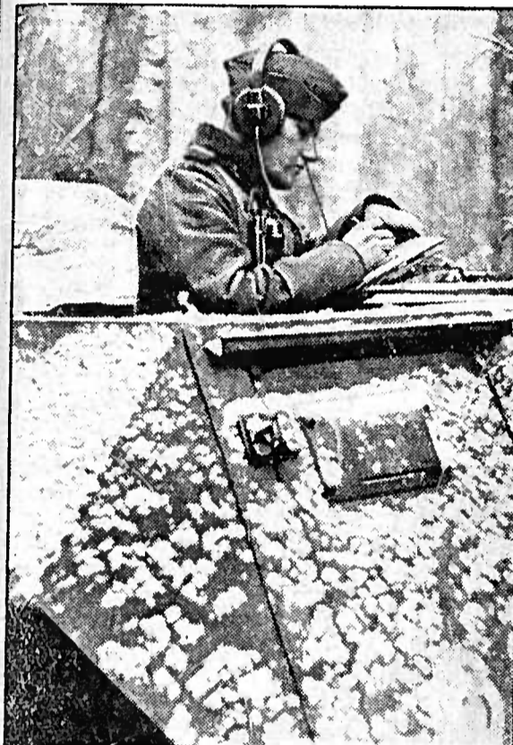
Der Funker eines Sturmgeschütz-Flügelwagens. Bei der Niedersturz eines aufsteigenden Spruches im winterlichen Wald der Waldai-Höhen.