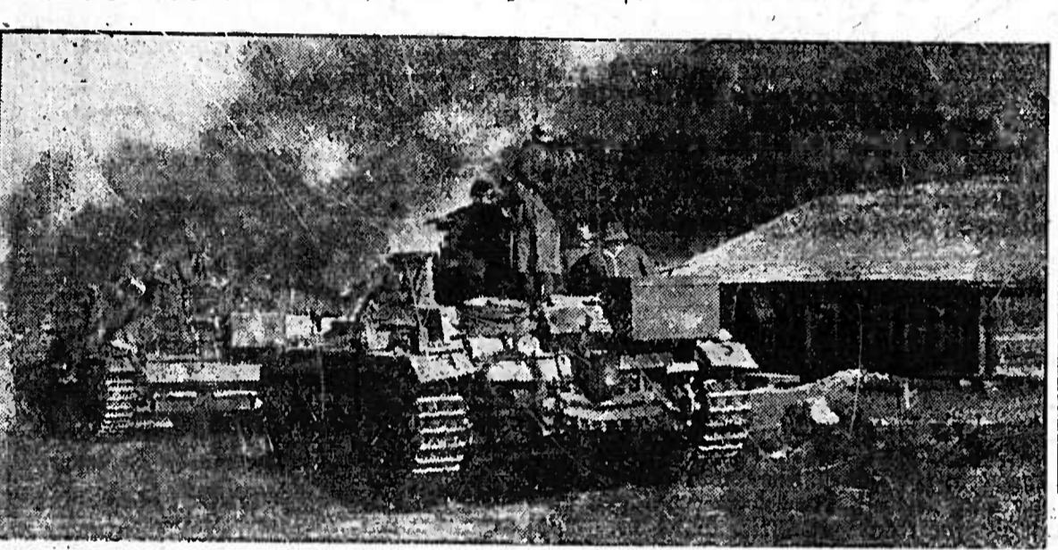
Vorausabteilung im Kampf. Die Panzerpiloten einer Kampfschwärme...