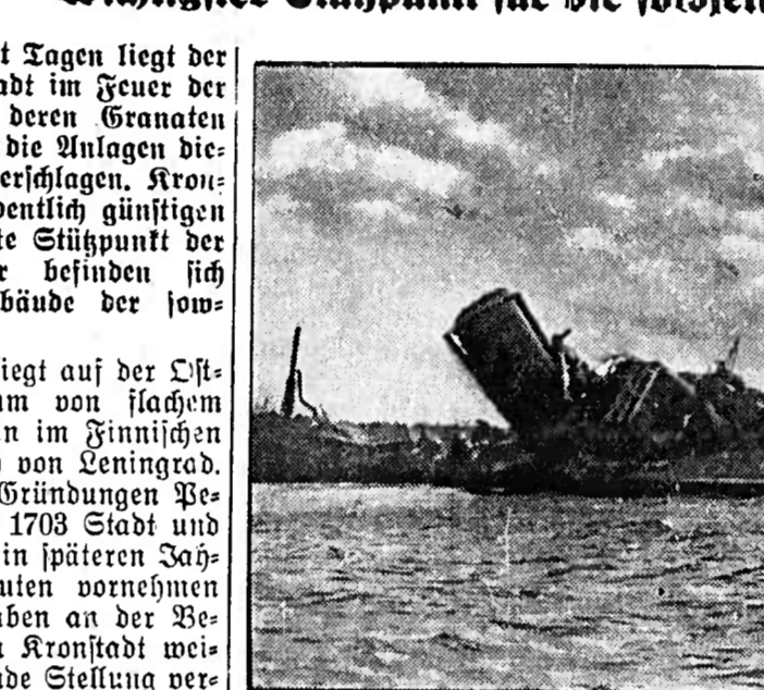
Die Artillerie schlug nicht mehr. Der sowjetische Minenkreuzer „Karl Marx“, der von deutschen Flugzeugen in einem Hafen im finnischen Meerbusen zerstört wurde.

DNB Berlin, 6. Okt. Seit Tagen liegt der sowjetische Kriegshafen Kronstadt im Feuer der schweren deutschen Artillerie, deren Granaten in fast ununterbrochener Folge die Anlagen dieses sowjetischen Kriegshafens zerstören.