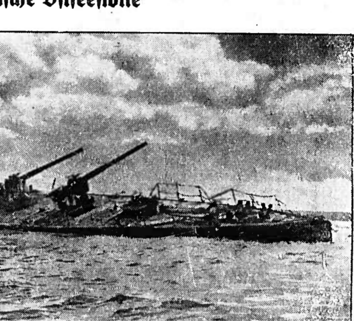
Die Artillerie schlug nicht mehr. Der sowjetische Minenkreuzer „Karl Marx“, der von deutschen Flugzeugen in einem Hafen im finnischen Meerbusen zerstört wurde.

DNB Berlin, 6. Okt. Seit Tagen liegt der sowjetische Kriegshafen Kronstadt im Feuer der schweren deutschen Artillerie, deren Granaten in fast ununterbrochener Folge die Anlagen dieses sowjetischen Kriegshafens zerstören.