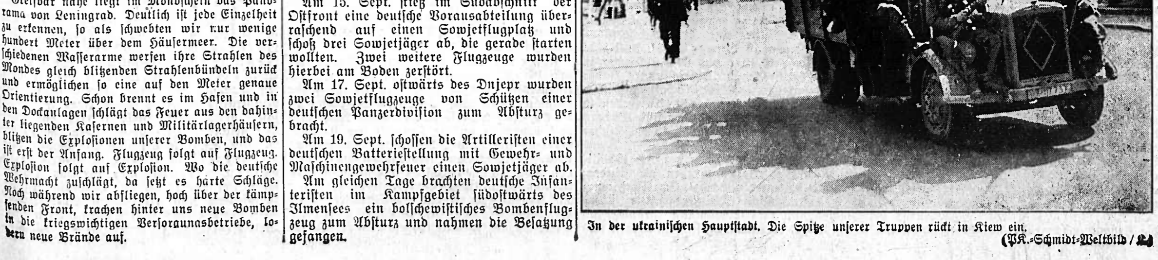
In der ukrainischen Hauptstadt. Die Spitze unserer Truppen rückt in Kiew ein.

Im Verlauf des 10. Sept. verloren die Der Kampf gegen die britische Versorgungsflotte verlief die Luftwaffe in der letzten Nacht ostwärts der Summerrückführung des Hafens von Great Yarmouth. Bei der Abwehr eines feindlichen Luftangriffes auf einen Geleitzug schossen Minensuchboote vier britische Flugzeuge ab. Kampfanhandlungen des Feindes über dem Mittelmeer fanden weder bei Tage noch bei Nacht statt.