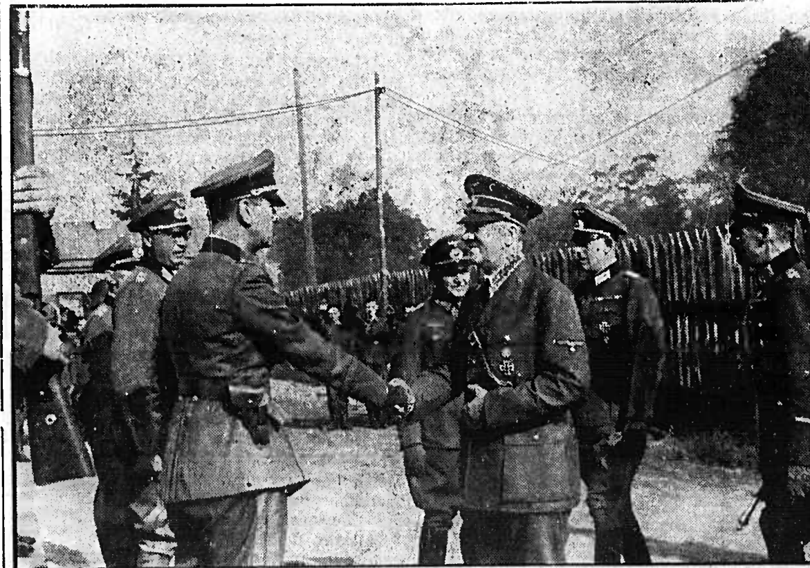
Der Führer besucht die Seeresgruppe Süd. Der Führer nimmt im Hauptquartier der Seeresgruppe Süd die Meldung mehrerer Offiziere entgegen. Ganz rechts Generalfeldmarschall von Raube.

Auf der Flussstraße nach Nikolajew. Die deutsche Flotte hat sich dem Schwarzen Meer angeschlossen. Die Besetzung des Dniepr ist außerordentlich bedeutend.