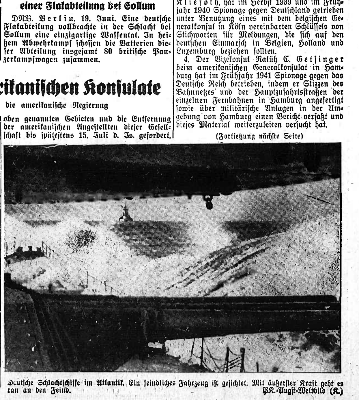
Deutsche Schiffschiffe im Atlantik. Ein feindliches Fahrzeug ist gesichtet. Mit äußerster Kraft geht es ran an den Feind. W. Augst-Welch (A.)