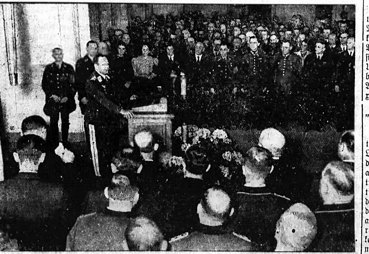
Bediente Kulkulanten im Haus der Flieger. Hund 100 verdiente Männer und Frauen aus dem ganzen Reich, die sich im Luftschutzbüro versammelt haben, waren Gäste im Haus der Flieger. Im Mittelpunkt der Veranstaltung stand eine Ansprache des Generalstabesmarschalls Rich (unter Bild).

21. Mai. Die irakische Heeresbericht vom Dienstag kam an der Westfront die irakische Vorhut mit dem Feind in der Gegend von Habbaniyah in Berührung und brachte ihm schwere Verluste bei.