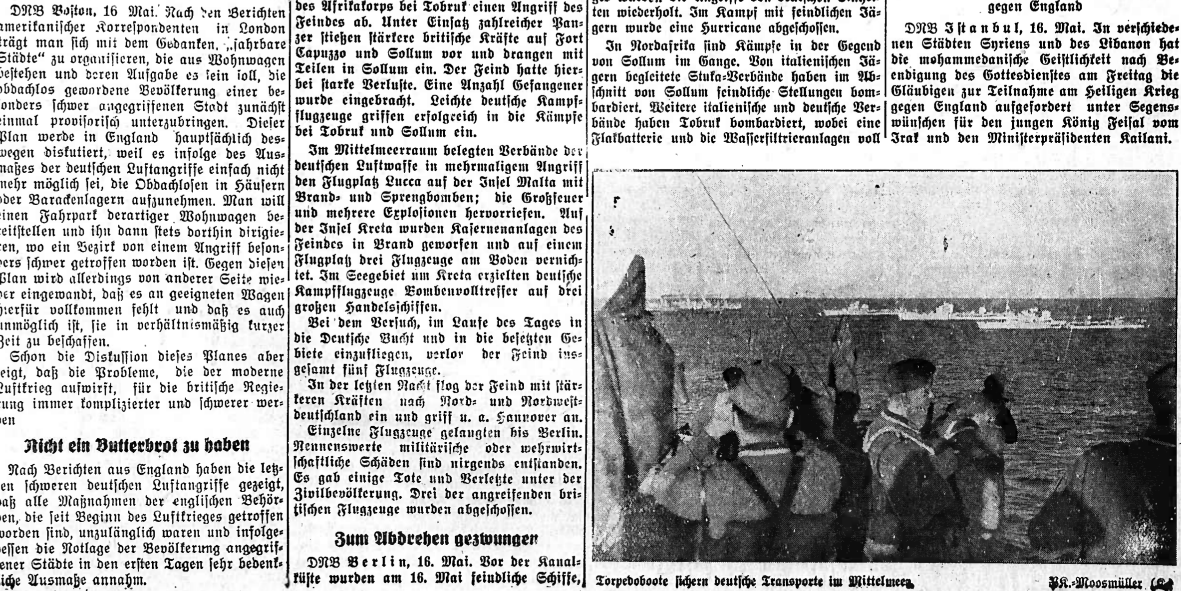
Torpedoboote liefern deutsche Transporte im Mittelmeer.

Wegzug will keinen Krieg 18. Mai. Genf. Von ägyptischer Seite in Genf verlautet: In den ägyptischen Zeitungen ist eine außenpolitische Erklärung des früheren Ministerpräsidenten und jetzigen Kammerpräsidenten Smail Sidi Pascha erschienen, worin die bisherige Neutralitätspolitik Ägyptens gebilligt und ihre Fortführung verlangt wird. Dagegen, die Ägypten in den Krieg ziehen möchten, werden beschuldigt, mit englischen Pfanden gekauft worden zu sein. Wenn dagegen England, so heißt es in der Erklärung weiter, uns zum Kriegseintritt an unserer Seite veranlassen wollte, so würde es das Gegenteil erreichen; wir würden uns dann verhalten wie der Irak und den Engländern den Krieg erklären. Ägypten ist damit dem König neutral geblieben und wird es bleiben. Sidi Pascha hat diese Erklärung vor einigen Tagen in der Kammer abgegeben. Weitere Aufrufe zum Heiligen Krieg gegen England 18. Mai. In verschiedenen Städten Syriens und des Libanon hat die moslemantische Geistlichkeit nach Bedenken des Gottesdienstes am Freitag die Gläubigen zur Teilnahme am Heiligen Krieg gegen England aufgefordert unter Segenswünschen für den jungen König Feisal vom Irak und den Ministerpräsidenten Rikani.