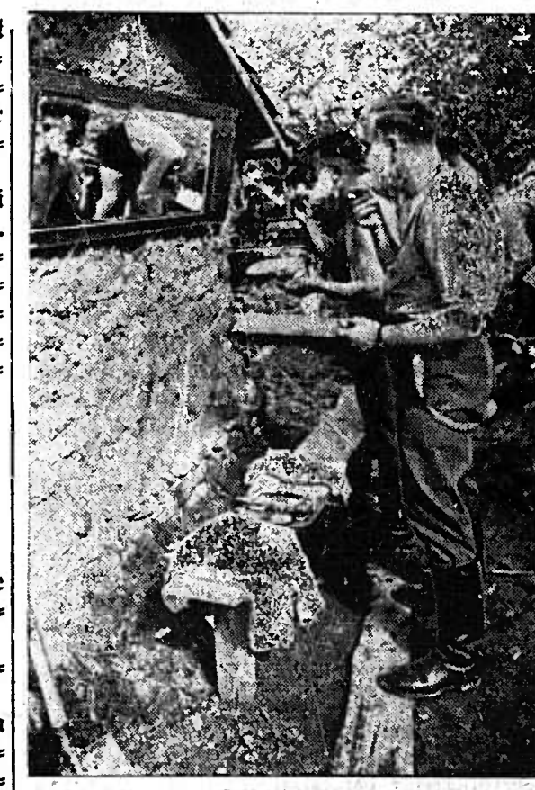
Ein deutsches Fliegerlager in Griechenland.

Sagesangriffe auf Plymouth und Newcastle Der Feind unternahm in der letzten Nacht mit schwachen Kräften wirkungslos einen Angriff auf einige Teile des nordwestlichen Küstengebietes. Es entstand weder mehrschichtiger noch militärischer Schaden. An der Nacht vom 30. April bis 6. Mai verlor der Feind zusammen 55 Flugzeuge. Von diesen wurden 30 Flugzeuge in Luftkämpfen, zehn durch Einzelheiten der Kriegsmarine und vier durch Flakartillerie abgeschossen, der Rest am Boden zerstört. Während der gleichen Zeit gingen 38 eigene Flugzeuge verloren. Der italienische Wehrmachtsbericht Fortgang der Operationen um Tobruk Der Feind unternahm in der letzten Nacht mit schwachen Kräften wirkungslos einen Angriff auf einige Teile des nordwestlichen Küstengebietes. Es entstand weder mehrschichtiger noch militärischer Schaden. An der Nacht vom 30. April bis 6. Mai verlor der Feind zusammen 55 Flugzeuge. Von diesen wurden 30 Flugzeuge in Luftkämpfen, zehn durch Einzelheiten der Kriegsmarine und vier durch Flakartillerie abgeschossen, der Rest am Boden zerstört. Während der gleichen Zeit gingen 38 eigene Flugzeuge verloren.