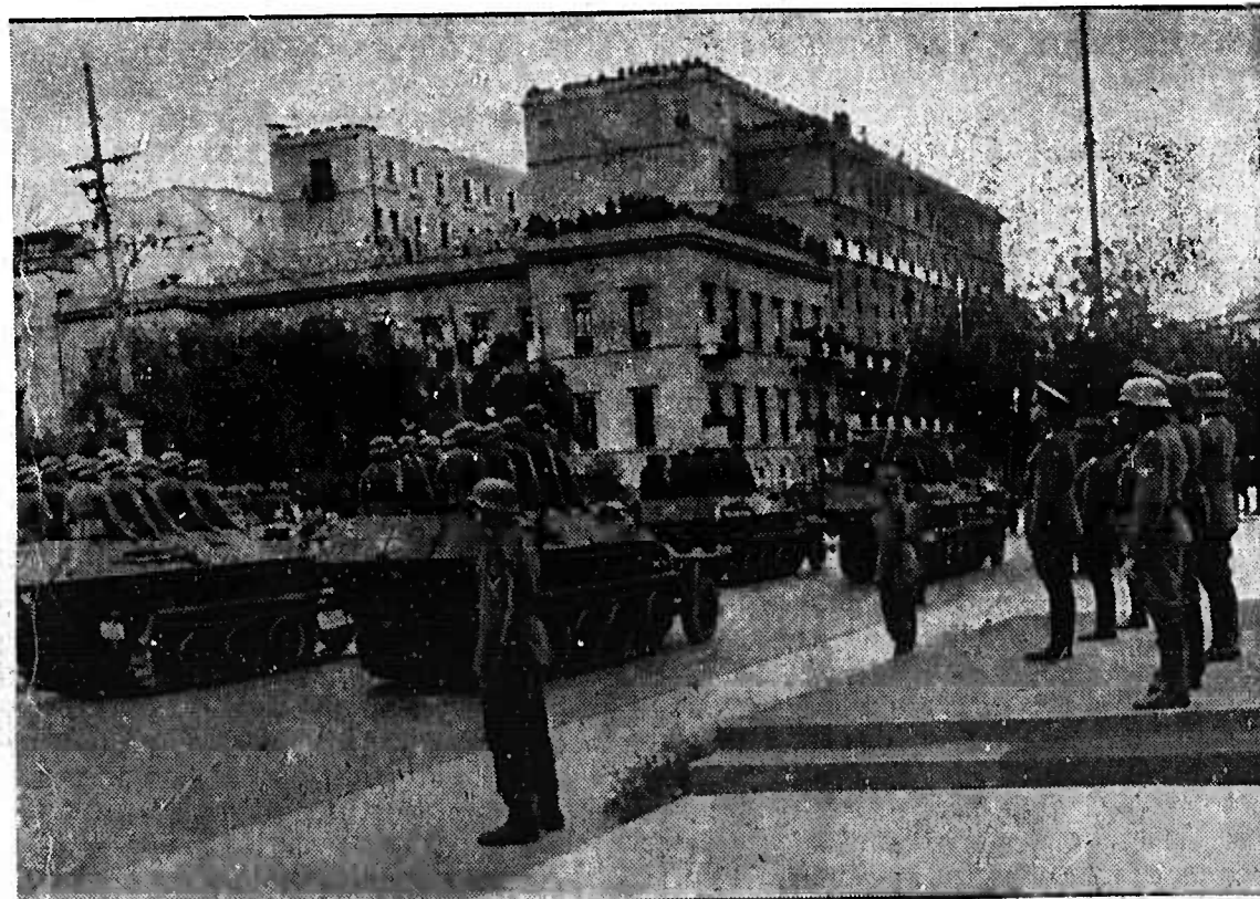
Stegparade in Athen. Parade der deutschen Truppen vor Generalfeldmarschall Hitler.

Der amerikanische Wehrmachtbericht Der amerikanische Wehrmachtbericht vom Donnerstag hat folgenden Wortlaut: Das Hauptquartier der Wehrmacht gibt bekannt: In den Nächten vom 7. und 8. Mai haben Verbände des deutschen Fliegerkorps zu wiederholten Malen zum Gegenangriff überholt, empfindliche Verluste erlitten.