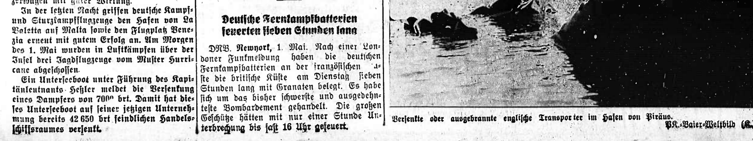
Verbrannte oder ausgebrannte englische Transporter im Hafen von Piräus.

Der Bericht des DNR Der Bericht des DNR Der Bericht des DNR