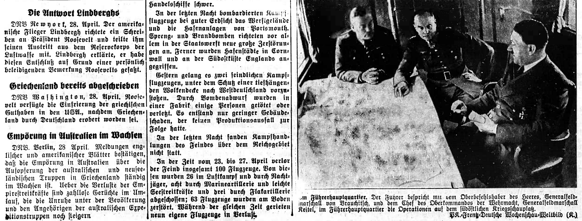
Im Führerhauptquartier. Der Führer bespricht mit dem Oberbefehlshaber des Heeres, Generalfeldmarschall von Brauchitsch, und dem Chef des Oberkommandos der Wehrmacht, Generalfeldmarschall Keitel, den überragenden Kriegserfolg.

biets Mittelgriechenlands und des Peloponnes verliefen planmäßig. Verbände der Luftwaffe griffen feindliche Kräfte im Raum um Argos-Tripolis mit guter Wirkung an. In Nordafrika brachen feindliche Vorstöße aus Tobruk heraus unter schweren Verlusten für den Feind zusammen. Deutsche und italienische Sturzkampfflugzeuge griffen am 27. April unter Jagdflug britische Artilleriestellungen am Marja-Watrat an und brachten durch Bombentreffer zwei Batterien zum Schweigen. Deutsche Jagdflugzeuge vernichteten in einem Hafen der Insel Malta ein viermotoriges britisches Flugboot vom Muster Sunderland. Die Bewegungen der Truppen des deutschen Heeres zur Säuberung der restlichen Ge-