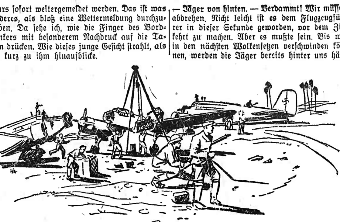
Matorenwechsel mitten in der Wüste. Bei einem Feindflug mußte ein Ju. 88, wie wir kürzlich berichteten, mitten in der Wüste im feindlichen Gebiet notlanden. Zwei Junkers Ju. 52-Transporter brachten einen Ersatzmotor auf dem Luftwege heran, landeten neben der notgelandeten Ju. 88, und die Besatzungen bauten in kürzester Zeit, die Arbeit mit W.M. bedend, trotz feindlicher Gegenwehr den Motor ein. Alle drei Junkers-Maschinen starteten und kamen wohlbehalten wieder in ihrem europäischen Heimatlande an. Weisbach (M.)

gen. Es ist schon ein toller Secht, unser Flugzeugführer.