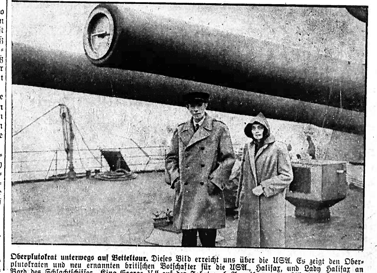
Überplutet unterwegs auf Vellefonte. Dieses Bild erreicht uns über die USA. Es zeigt den Oberplutoten unterwegs auf Vellefonte...