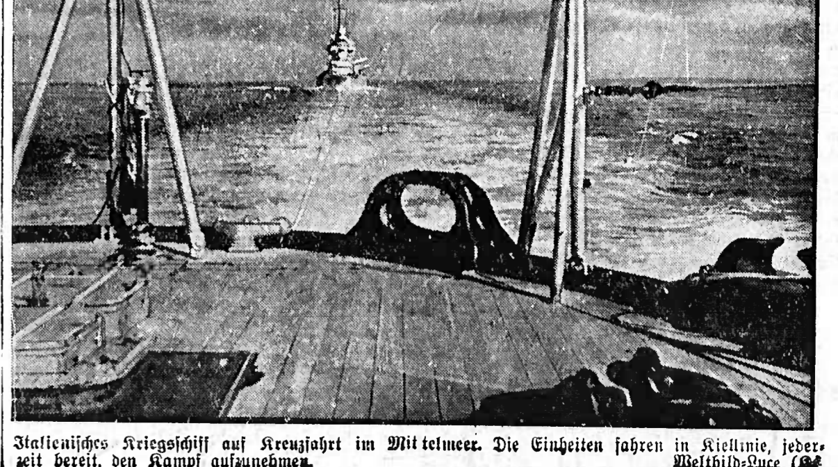
Italienisches Kriegsschiff auf Kreuzfahrt im Mittelmeer.

Lebhafte Angriffstätigkeit der italienischen Luftwaffe - Angriffe des deutschen Fliegerkorps auf die Flugplätze Malta.