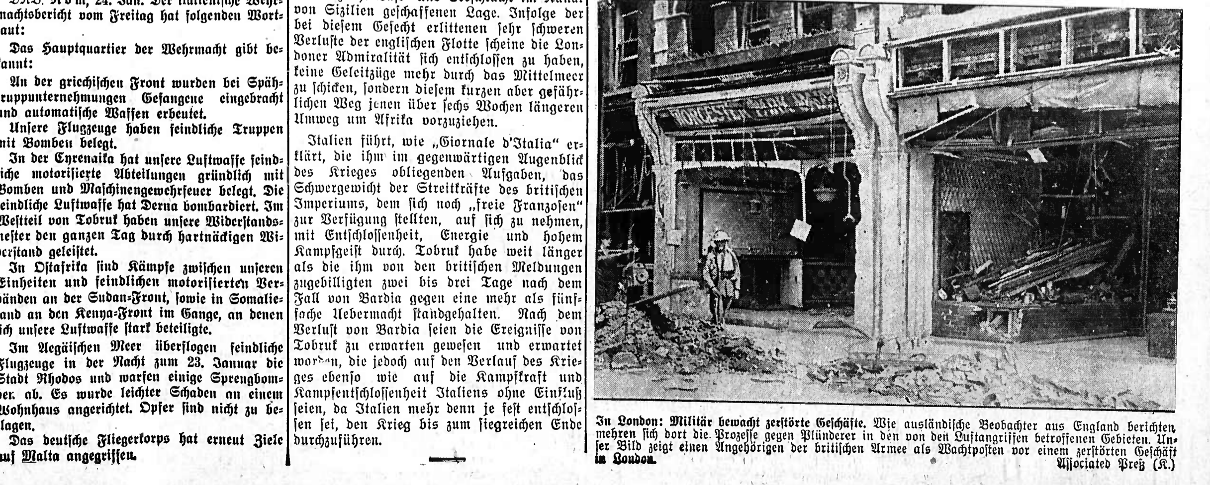
In Tobruk: Militäreinheiten bewachen zerstörte Gebäude. Wie ausländische Beobachter aus England berichten, haben sich dort die Briten gegen die Italiener in dem von den Luftangriffen betroffenen Gebiet. Unter Bild zeigt einen Angehörigen der britischen Armee als Wachposten vor einem zerstörten Gebäude.