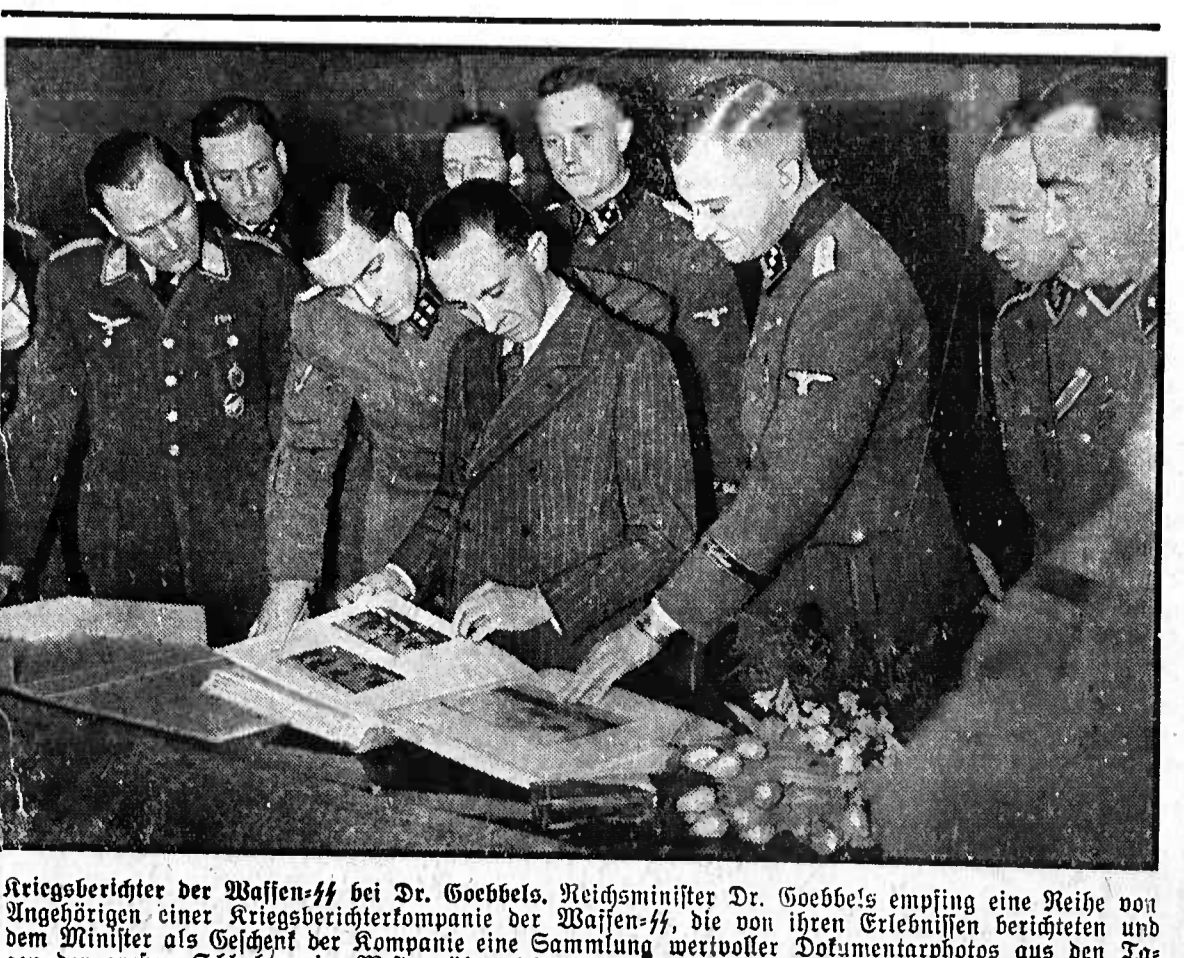
Kriegsbericht der Wehrmacht bei Dr. Goebbels. Reichsminister Dr. Goebbels empfing eine Reihe von Angehörigen einer Kriegserichterkompanie der Wehrmacht, die von ihren Erlebnissen berichteten und dem Minister als Geschenk eine Sammlung wertvoller Dokumentarphotos aus den Tagen der großen Schlachten im Westen überreichten.

Der Kreuzer „Southampton“ gehört zur „Birmingham“-Klasse. Er ist 1937 in Dienst gestellt worden, erreichte 32,5 Knoten und hatte 700 Mann Besatzung. Seine Bewaffnung bestand aus zwölf 15,2 cm-Geschützen sowie acht 10,2 cm- und einer Reihe leichter Luftabwehrgeschütze.