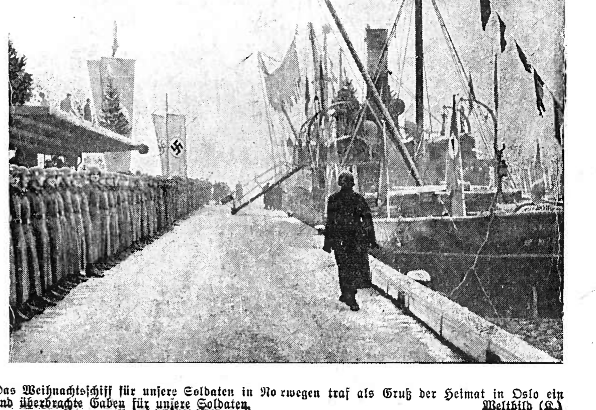
Das Weihnachtsgeschick für unsere Soldaten in No rwegen traf als Gruß der Heimat in Deso ein und überbrachte Gaben für unsere Soldaten.

Keine besonderen Ereignisse Der Wehrmachtsbericht vom 26. Dezember. Der Wehrmachtsbericht vom 26. Dezember. Die Besonderen Ereignisse.