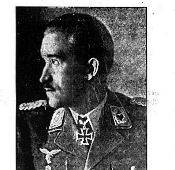
Adolf Hitler — der dritte Träger des Eisernen Kreuzes.

Der Führer an den Duce Italiens: „Duce! Soeben ist der Dreimächtepakt zwischen dem italienischen Italien, dem nationalsozialistischen Deutschland und dem hellenistischen Japan unterzeichnet worden.“