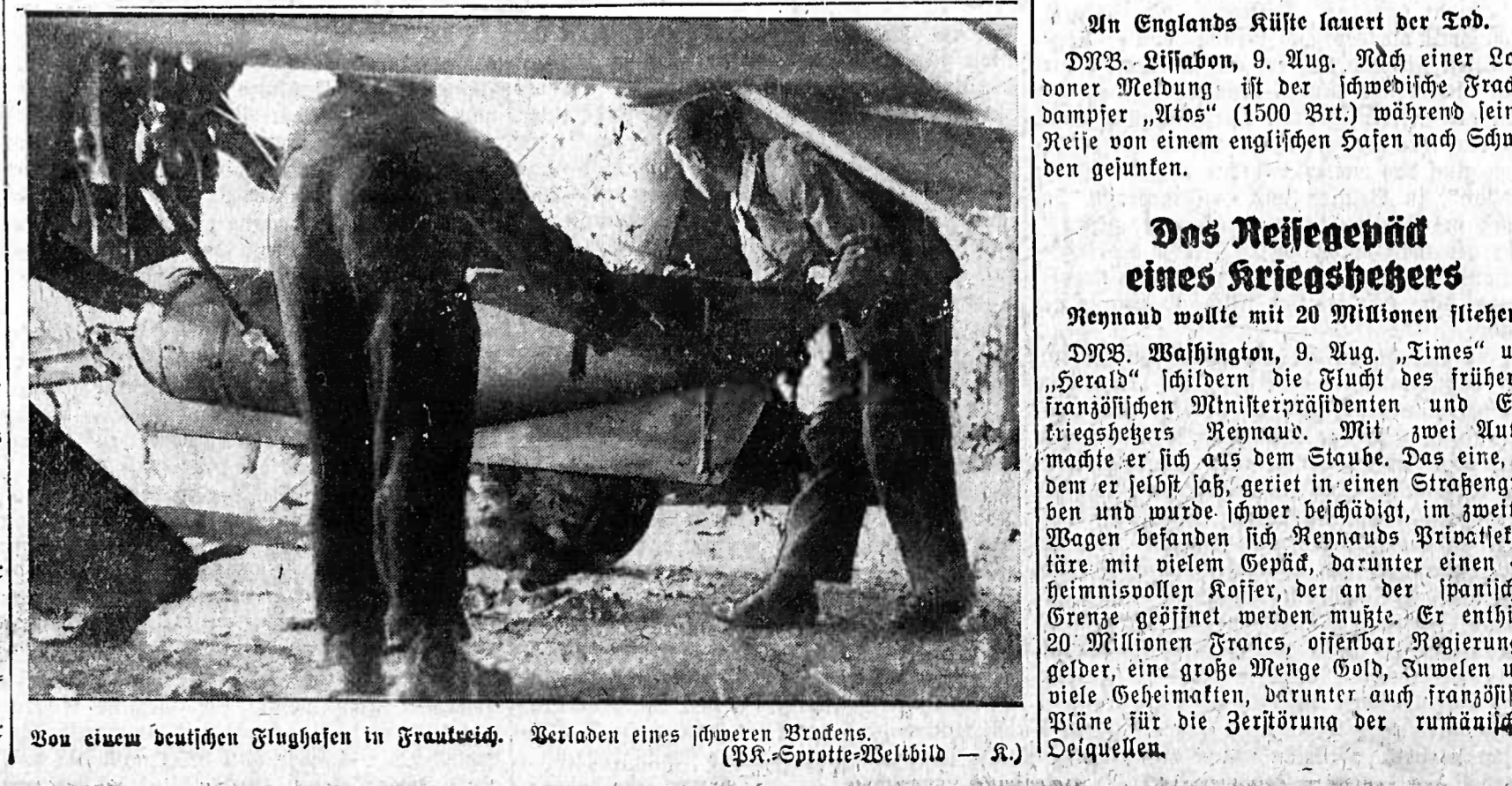
Von einem deutschen Flugzeug in Frankreich. Verladen eines schweren Brakens. (BR-Spottel-14611b - 8.)