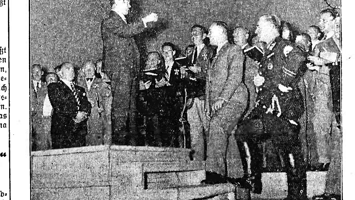
Der Wiener Männergesangsverein im Deutschlandsender.