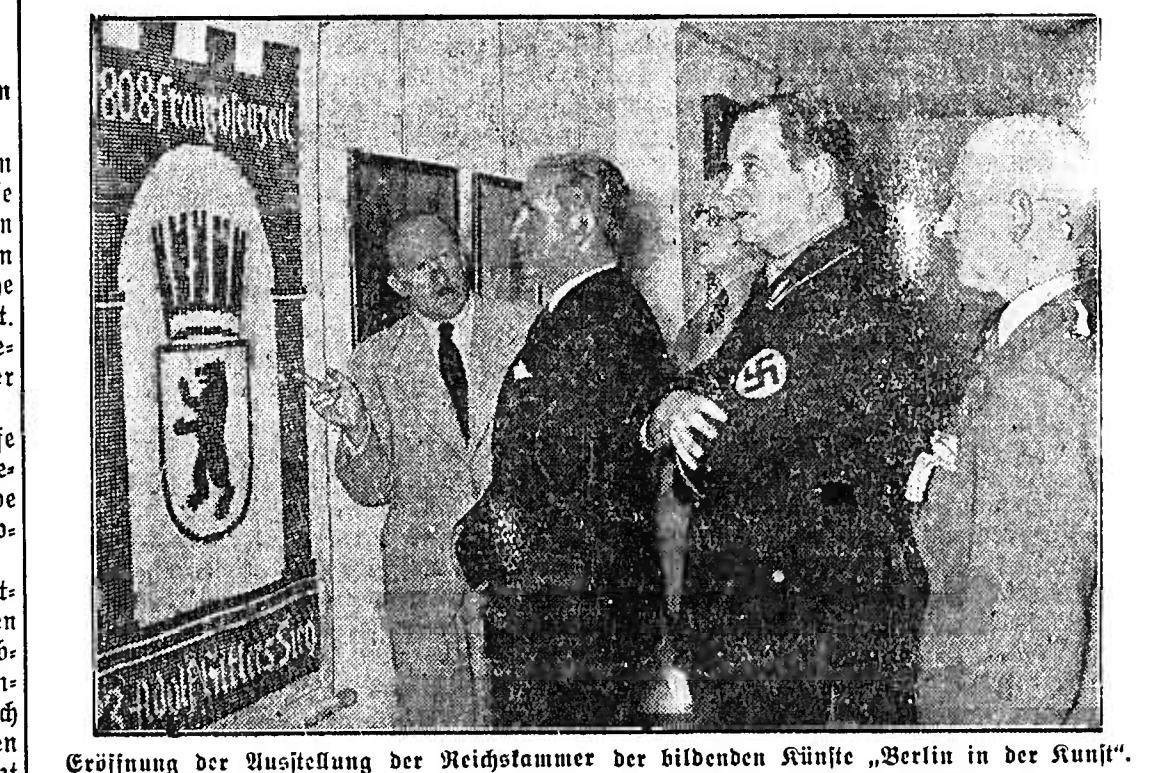
Eröffnung der Ausstellung der Reichslammer der bildenden Künste „Berlin in der Kunst“.