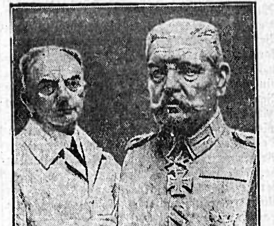
Eine Hindenburg-Büste für das Armeemuseum.

Wir müssen uns erneut mit aller Mühe... die Frage vorlegen, ob die deutschen Ex-