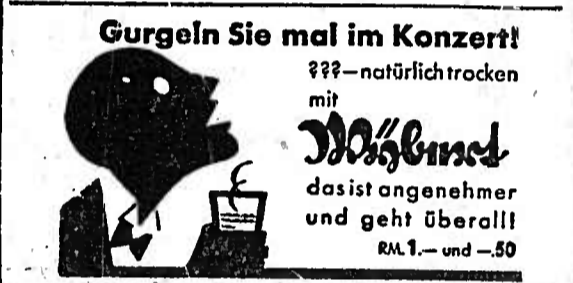
Gurgeln Sie mal im Konzert! Nicht mit gewöhnlichen, sondern mit Wagner'schen und geht überall. RM 1,- und -50

Einschneidende Maßnahmen bei der Deutschen Luftkassa, M.B. Berlin, 4. Okt. Die allgemeine Erklärung der Wirtschaftslage veranlaßt die Deutsche Luftkassa vorfristig zu einer Reihe von einschränkenden Maßnahmen, um auch im kommenden Winter und im nächsten Jahr im Einklang mit den zur Verfügung stehenden Mitteln ihren Luftverkehr prämäßig durchführen zu können.