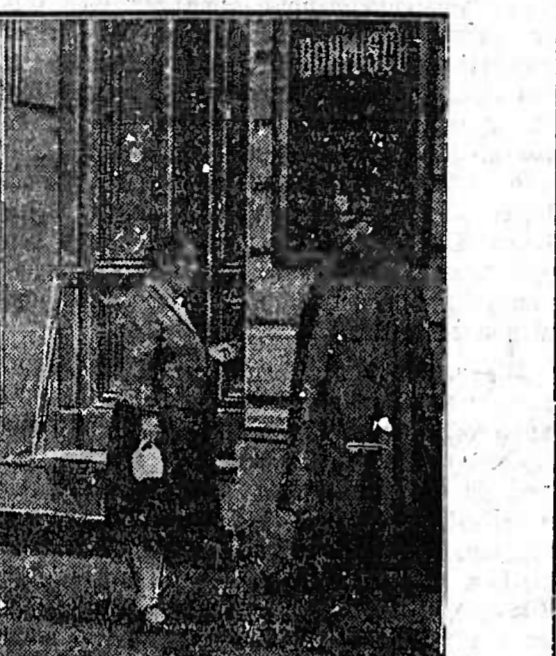
Am 31. August 1931 besuchte Herr Minister Dr. Müller die in der Tilsiter Straße in Berlin entdeckte Munitionskammer.

Amerika (10 301 Logiernächte). Die weitere Reihenfolge ist Holland (9288), England (8055), Schweiz (8361); in weitem Abstand folgen Frankreich und Oesterreich.