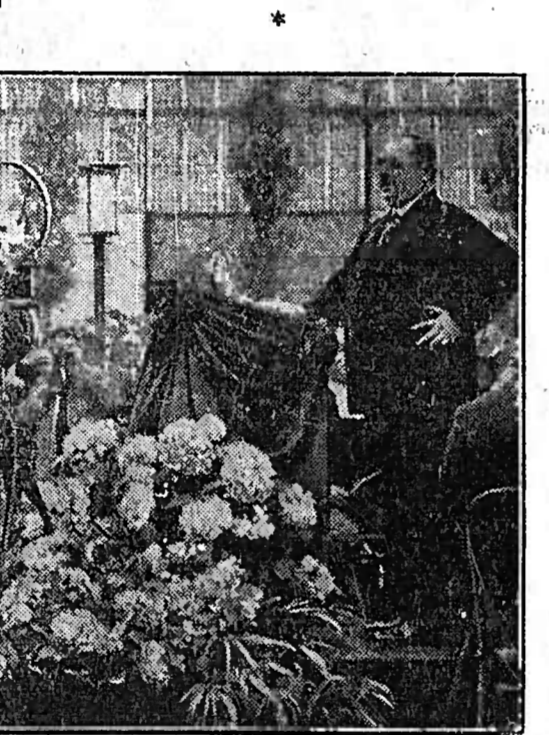
Die Eröffnung der Großen Deutschen Zunftausstellung.