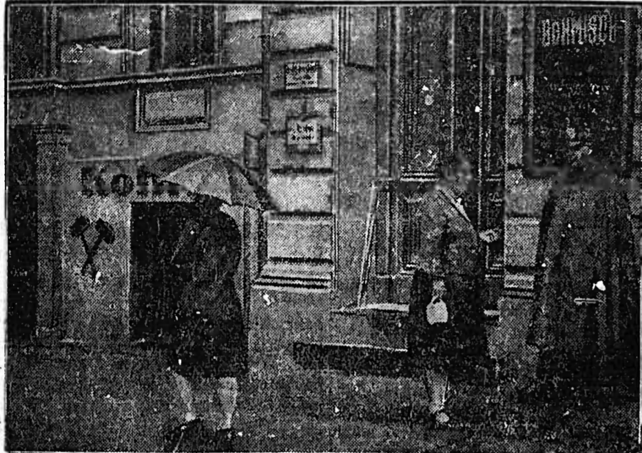
In einem Keller in der Tilsiter Straße in Berlin wurde von der Polizei ein großes Waffenlager entdeckt, das aus 12 Kisten Munition, Pistolen und Chemikalien besteht.

Der Fremdenverkehr im Juli hat sich besser entwickelt, als bei der Ungunst der Witterung und nach den kühleren Frühlingsagen dieses Monats zu befürchten war.