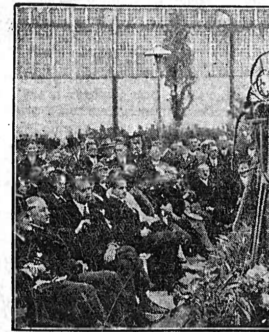
Die Eröffnung der Großen Deutschen Zunftausstellung.