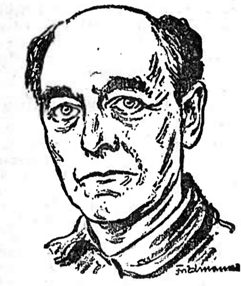
Dr. Felix Weingartner.

Die französische nationalsozialistische Presse hat die Ablehnung zweier Konzerte erzwungen, die Dr. Felix Weingartner — einer der hervorragendsten europäischen Musikinterpreten — in Paris dirigieren sollte.