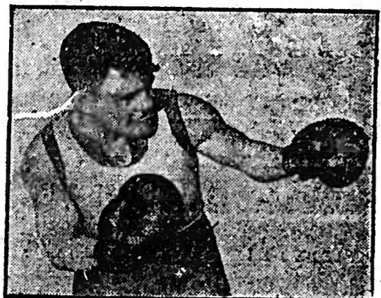
Um den Titel des Deutschen Halbschwergewichtsmesters