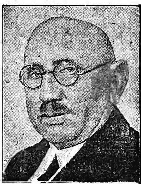
Der Schlichter im Ruhrkonflikt

erst am 15. Januar wirksam wird, bleibt hierfür auch noch hinreichend Zeit.