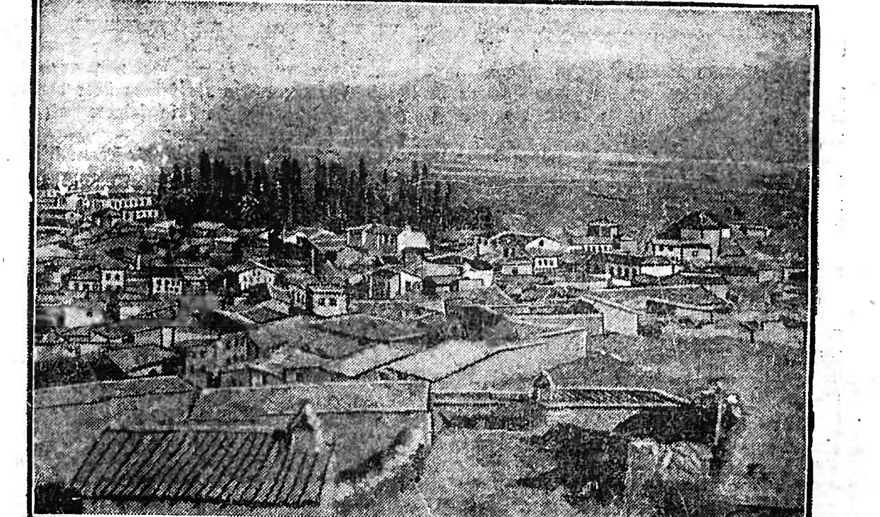
Der Schauplatz eines Blutbades aus religiösem Fanatismus war die kleinasiatische Stadt Menemen (nördlich Smyrna), wo ein Derwisch — mit der großen Fahne des Propheten in der Faust — die Bevölkerung gegen die Regierung aufzuwiegen versuchte. Einem Geistlichen, der dem Derwisch Schweigen gebot, wurde der Kopf abgehauen, der auf die Fahne aufgesteckt wurde. Als die Gendarmen eingegriffen wollten, verbrannten sich die Fanatiker in einer Mobszene und erschafften ein Feuergefecht, in dessen Verlauf zwei Gendarmen und vier der Emuere den Tod fanden.

Freibank Emmendingen Morgen vormittag von 8 Uhr an wird Ruhfleisch ausgehoben, das Pfund für 60 Pfennig 6250