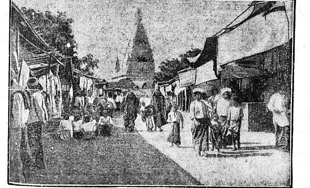
Gärung in Burma. In der hinterindischen Provinz Burma, aus der wir das typische Bild eines Dorfes zeigen, kam es bei Steuererhebungen zu blutigen Unruhen. Mehrere englische Beamte wurden erschossen, Gendarmen getötet und Telegraphenstationen zerstört. Englische Truppen mit Maschinengewehren haben die Befestigung der Aufständischen aufgenommen, die bereits 30 Tote verlorren haben.

1. Erdbeben in Argentinien: die argentinische Stadt La Plata in den Anden wurde durch ein Erdbeben zerstört, bei dem 60 Menschen den Tod fanden. — 2. Unstille unter der Fahne des Propheten: in der kleinasiatischen Stadt Menemen kam es zwischen den Anhängern eines fanatischen Derwisches, der zum Aufstand gegen die Regierung predigte, und der Gendarmerie zu einem Feuergefecht, bei dem vier Fanatiker und zwei Gendarmen erschossen wurden. — 3. Aufstand in Burma: in der hinterindischen Provinz Burma entstand anlässlich von Steuererhebungen eine blutige Revolte der Eingeborenen, in deren Verlauf mehrere englische Beamte und 80 Eingeborene getötet wurden.