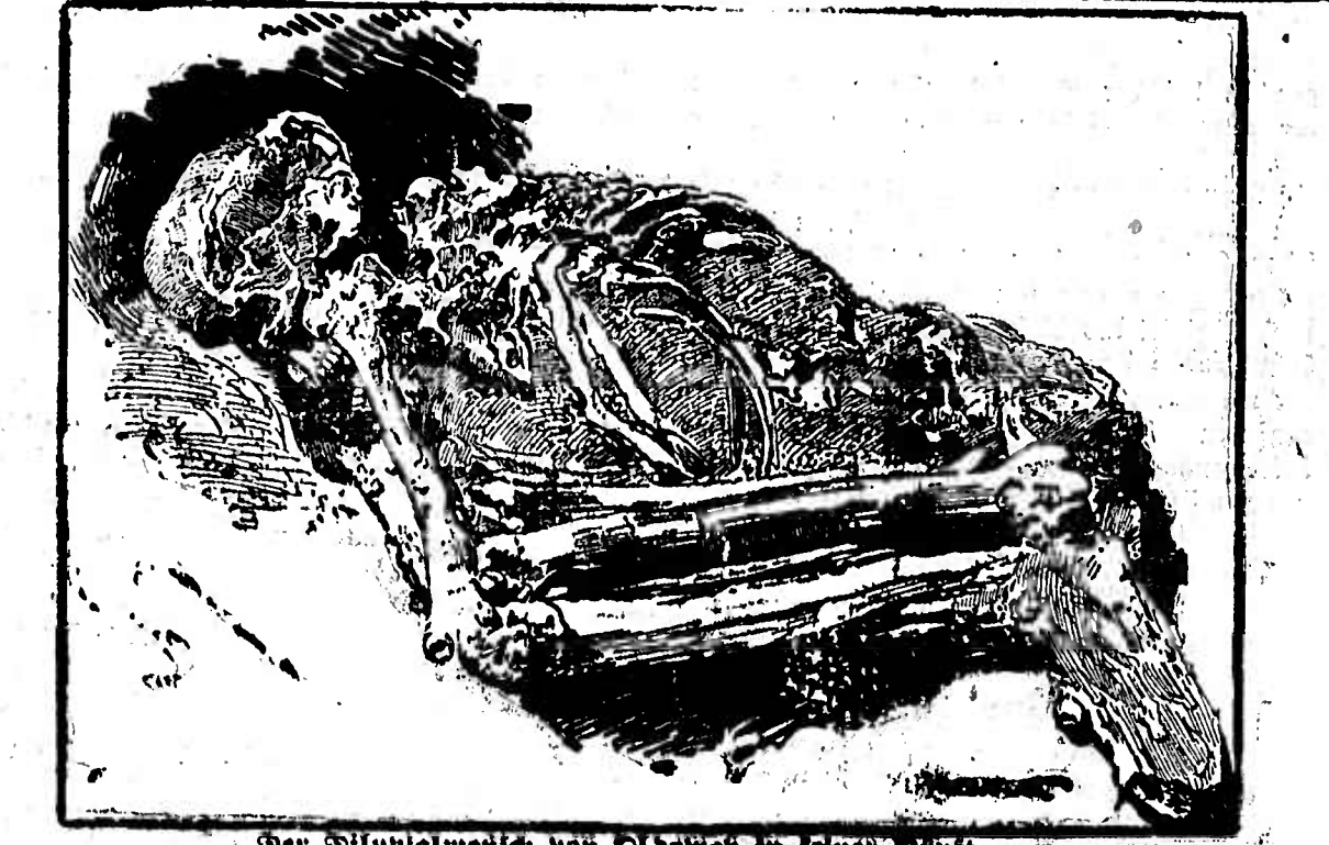
Der Diluviale Mensch von Oldoway in seiner Gruft.

Der diluviale Mensch von Oldoway. Dr. G. Meck, einem jungen Forscher, ist es gelungen, einen viele Dutzende alte fossilen Menschen im nordöstlichen Deutsch-Ostafrika im Gestein der Oldoway-Schlucht aufzufinden. Der Fund scheint die Erkenntnis befestigen zu wollen, dass der Menschstamm viel älter ist, als man lange glaubte, dass er sich frühzeitig schon in vielseitiger Richtung entfaltete und dass einzelne Rassen in früher diluvialer Zeit eine Entwicklungshöhe erreicht haben, die bei anderen zurückgebliebenen Typen auch heute noch lebend erhalten ist.