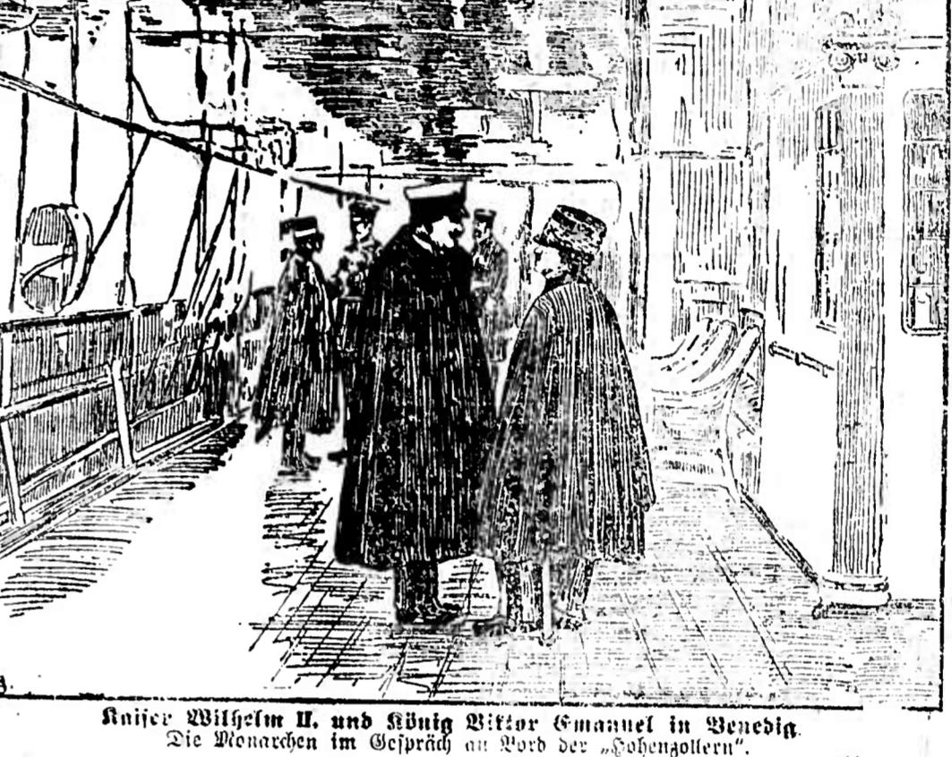
Kaiser Wilhelm II. und König Viktor Emanuel in Venedig.

Auf seiner Korfu-Reise traf unser Kaiser in Venedig auch mit seinem Verbündeten, dem König Viktor Emanuel von Italien, zusammen.