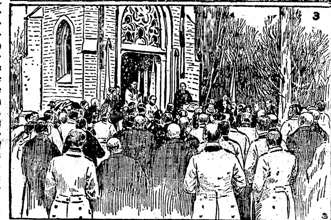
1. Empfang der österreichischen Offiziere in Schleswig. 2. Schmelzung des Kriegerehrenmals bei Segel durch österreichische Offiziere und Veteranen. 3. Die Feier vor der österreichischen Kapelle in Schleswig.

mentlich in Oesterreich, wo man noch die Folgen der russischen Probemobilisation in allen Gliedern des wirtschaftlichen Körpers spürt, recht heroisch wird, zumal der russische Rubel, der ja sonst auch den Weg in das Generalstabsbüro des Trägers Kriemsee gefund hat, bei den armen und unterdrückten russischen Bauern an der Ostgrenze der Monarchie wahre Befreiungswunder verurteilen soll.