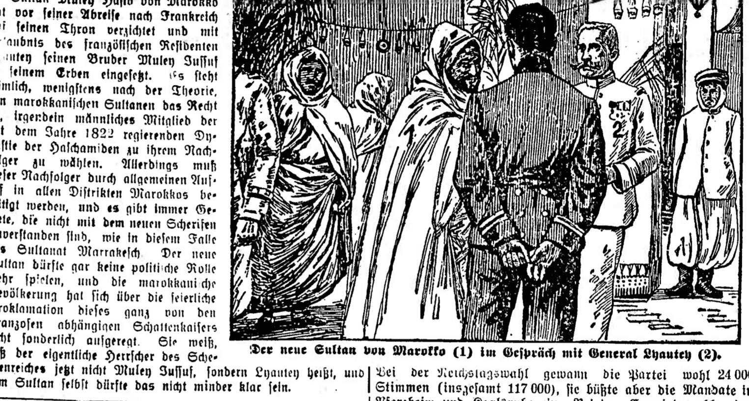
Der neue Sultan von Marokko (1) im Gespräch mit General Hyanteh (2).

Der Untersuchungsrichter nahm keine Notiz von Ribots Bemerkung, sondern fragte, wie Herr Boiscoran gekleidet gewesen.