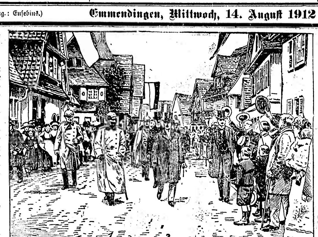
Kaiser Wilhelm (1) mit Herrn Krupp von Bohlen und Halbach (2) bei Besichtigung der Kruppwerke in Essen.

Der Kaiser bei der Kruppfeier in Essen. Die Jahreshunderter des Hauses Krupp ist von ganz Essen mitgeleitet worden.