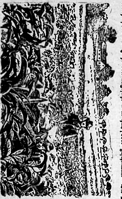
Ein Landschaftsbild mit einem Fluss.

Die Arbeit in der Feldarbeit ist eine sehr schwere und anstrengende Tätigkeit. Die Arbeiter müssen sich viel körperlich betätigen und sind oft in der Sonne oder in der Kälte. Die Arbeit in der Feldarbeit ist eine sehr schwere und anstrengende Tätigkeit.