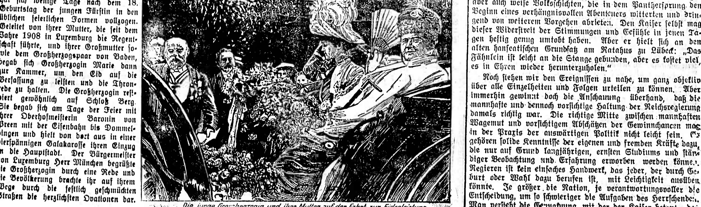
Die junge Großherzogin und ihre Mutter auf der Fahrt zur Eidobachtung.

Verhändigungsblatt der Stadt Emmendingen. Vertrieben in den Amtsbezirken Emmendingen (Senzingen), Bretsch, Ettenheim, Waldkirch und am Kaiserstuhl.