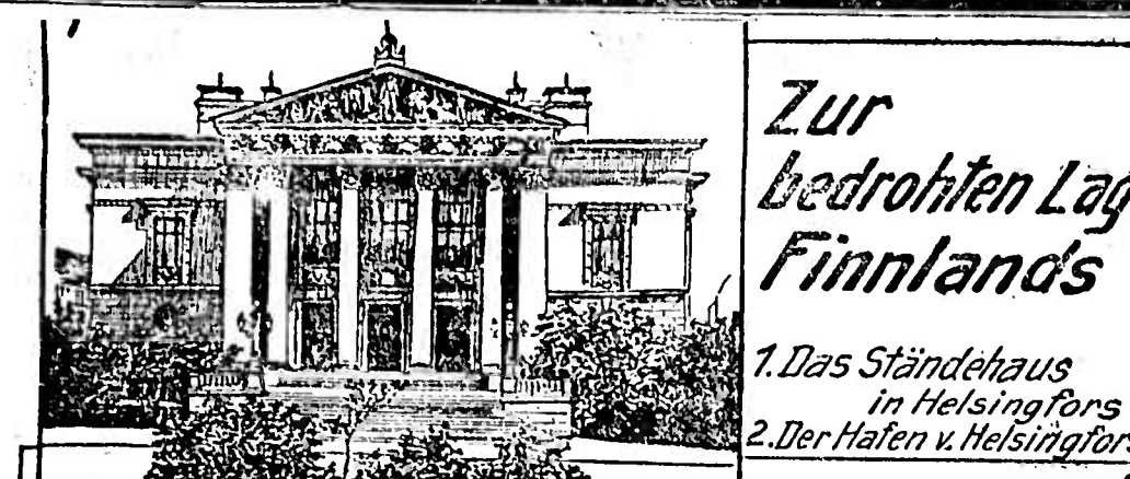
Zur bedrohten Lage Finnlands. 1. Das Ständehaus in Helsingfors. 2. Der Hafen von Helsingfors.

Der latente Konflikt zwischen dem relativ kleinen, aber kulturell hochentwickelten Groß-Finland und dem mächtigen russischen Kaiserreich, mit dem Finnland in Personalunion verbunden ist, hat sich dieser Tage aufs äußerste verschärft.