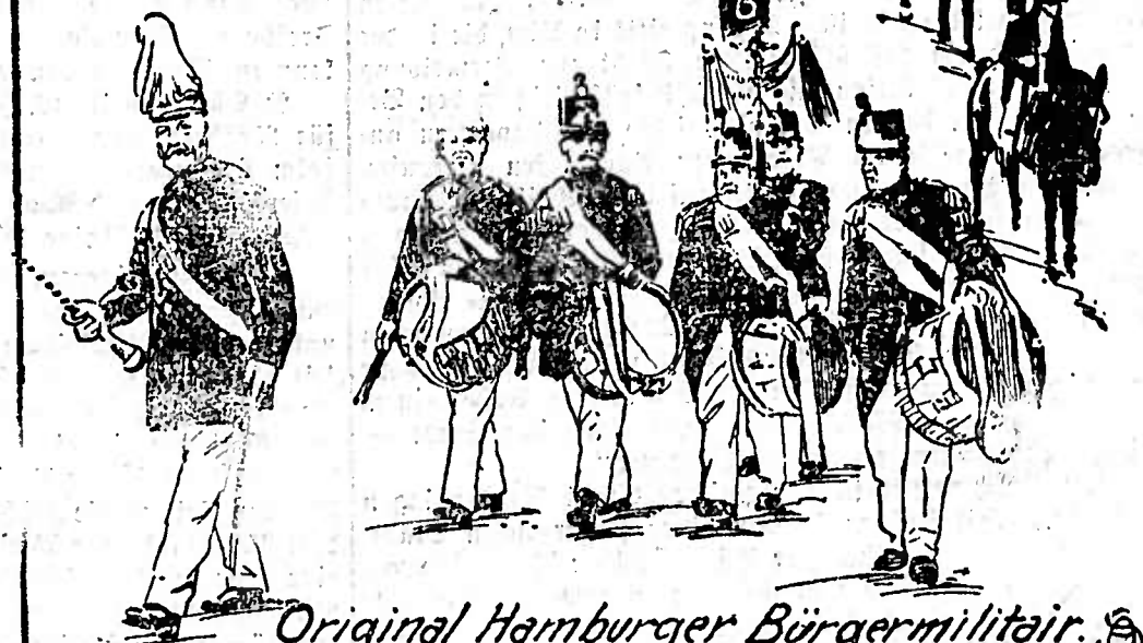
Original Hamburger Bürgermilitär.

Zündhölzer Jede Hausfrau zu den alten billigen Preisen welche nie wiederkehren. W. Reichelt 2783 Emmendingen.