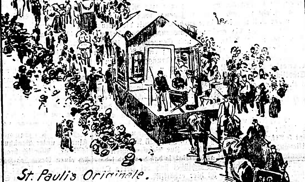
St. Pauli's Originale.