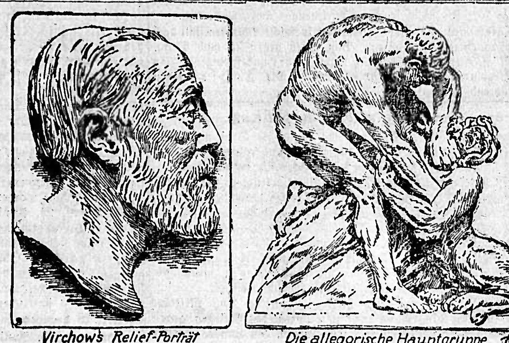
Virchow's Relief-Portrait Die allegorische Hauptgruppe

Das schicksalreiche Denkmal des großen Arztes wird demnächst auf dem Berliner Karlsplatz zur Aufstellung gelangen. Der zweite Entwurf des Bildhauers, dessen Ausführung der Kaiser gebilligt hat, unterscheidet sich von dem ursprünglichen Entwurf sehr wesentlich. Damals bestand das Werk hauptsächlich aus der großen allegorischen Gruppe, die den Kampf des Fortschritts gegen die wilden Gewalten des Übels darstellte. In dem neuen Entwurf ist die Gruppe kleiner und das Porträt Virchows größer zu machen und außerdem am Fußboden des Denkmals ein Relief anzubringen, das den verstorbenen Anatomen im Kreise seiner pathologischen Institute im Kreise seiner bedeutendsten Schüler und Freunde darstellt. Der Bildhauer hat hier in unübertrefflicher Weise auch einige seiner herrlichsten Gegenstände, so den jüngst verstorbenen Dr. Zangemeister, der gegen die Ausführung des Entwurfs von Klimsch aufgetreten war.