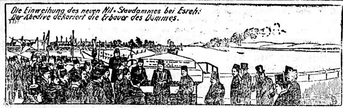
Die Einweihung des neuen Stilladammes bei Esch. Die Abbeide bedankt die Erbauer des Dammes.

In Esch in Pflanzung wurde in Anwesenheit des Abbeides der neue breite Stilladamm eingeweiht. Das mächtige Werk ist ein Sandsteinbau von 900 Meter Länge, der sich um neun Meter über den höchsten Wasserstand des Flusses erhebt. Der Damm hat 120 in regelmäßigen Abständen voneinander angebrachte Wehrtürme, an seinem Westende befindet sich eine 80 Meter lange Schleuse. Das Werk vollendet die großen Bewässerungsanlagen Westens, die dem trockenen Lande auch dann das befruchtende Wasser verschaffen sollen, wenn der Nil nicht eben seine Ufer überschreitet. Unser Bild stellt den Moment dar, in dem der Abbeide die Erbauer des Staumwerkes für ihre ausgezeichneten Leistungen bedankt.