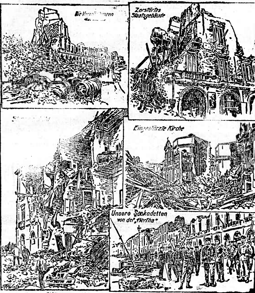
Wider von der Erdebenkatastrophe in Calabria. Die Soldaten von der 'Hertha' sind in der Stadt angekommen, um die Opfer zu trösten und die Noth zu lindern.

Es mehr Nachrichten von jenem großen Veld- und Erdbeben kommen, was die Elemente der menschlichen Lebens und der menschlichen Werke gespart haben, desto größer erscheint die Summe des Unglücks... Die Katastrophe war ein schweres Verhängnis über die Gegend, das die Menschen zu großen Verlusten brachte.